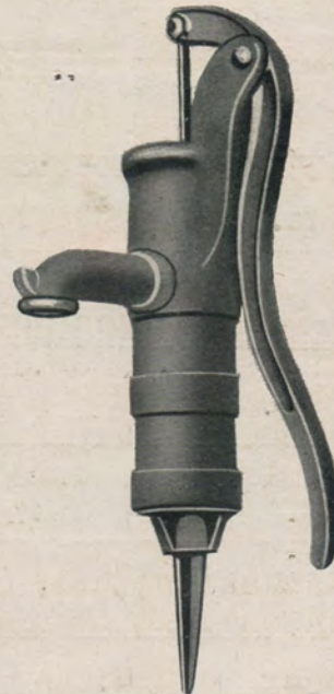
Saugpumpe „Reform“ mit oder ohne Flansch